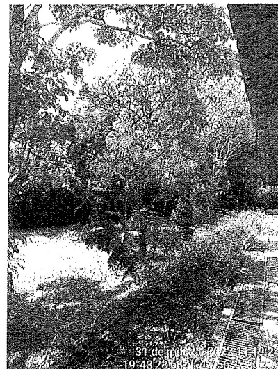
Leucenas a serem controladas